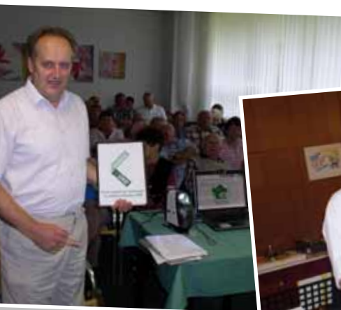
Prezentace na rekondicích